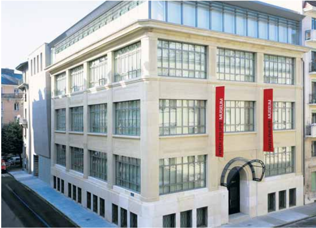
PATEK PHILIPPE MUSEUM