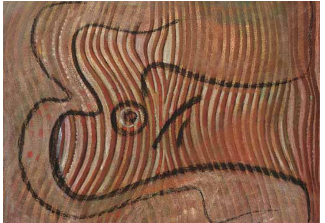
Jean Hirtzel, Pictogramme N°2 , 1989, huile, colle synthétique, sable et charbon de bois sur toile de lin, 81 x 100 cm. PROJET JEAN HIRTZEL

ESPACE GRAFFENRIED • Plus de 20 ans après la dernière exposition monographique consacrée à l'artiste, «Jean Hirtzel. Entre les lignes» revient sur le parcours et la vision du plasticien d'origine neuchâteloise, basé à Blonay (VD) jusqu'à sa disparition en 1999.