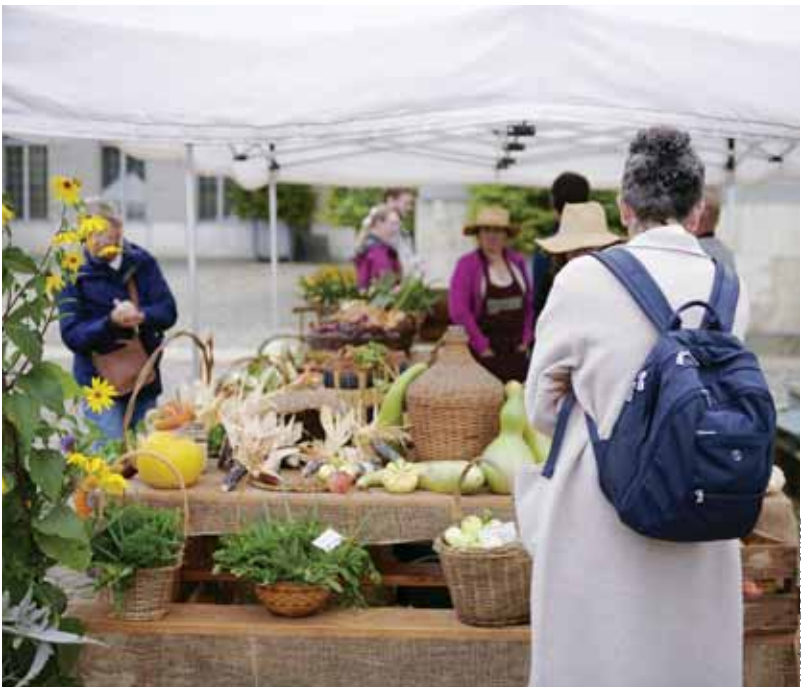
MUSEE NATIONAL SUISSE

CHÂTEAU DE PRANGINS - MUSÉE NATIONAL SUISSE • A l'occasion de la 9 e Journée des châteaux suisses, sous la thématique de Musique & Fête, le Château de Prangins propose, de 10h à 17h, de nombreuses activités pour grands et petits: marché du Potager avec vente des récoltes, atelier coloriage dès 3 ans, de jeux anciens dès 4 ans, d'écriture à la plume et de création de masque dès 6 ans. Visites guidées du château, du potager et de l'exposition «Indiennes. Un tissu à la conquête du monde». Démonstration et ateliers de danse du XVIII e , reconstitution d'un banquet, spectacle de danse baroque, visite interactive Madame tient salon... sans oublier votre pique-nique pour déjeuner dans la Cour d'honneur autour du chaudron au potage. Et si vous venez en costume du XVIII e , un espace «selfie» vous permettra d'immortaliser ce moment! Entrée du musée et activités gratuites. ■